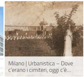
Milano | Urbanistica – Dove c'erano i cimiteri, oggi c'è...